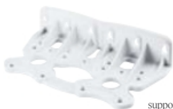
supporto murale -DUO-